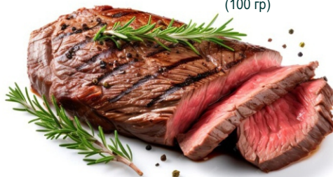
РИБАЙ RIBEYE 945 (100 гр)