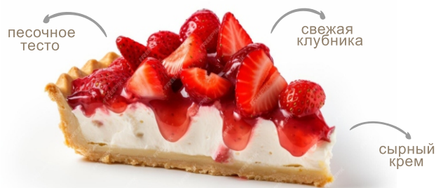
Тарт со свежей клубникой