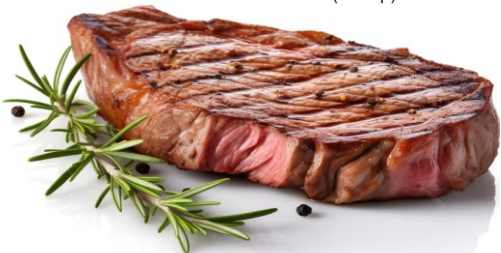
НЬЮ-ЙОРК ПРАЙМБИФ NEW YORK PRIME BEEF 815 (100 гр)