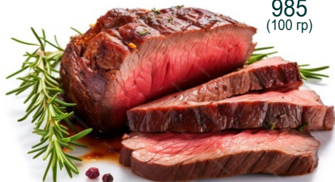
МИНЬОН MIGNON 985 (100 гр)