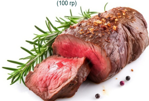
ШАТОБРИАН CHATEAUBRIAND 975 (100 гр)