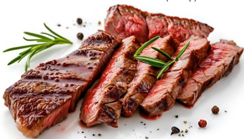
ФЛАНК FLANK 625 (100 гр)