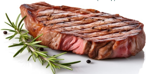
ШАТОБРИАН CHATEAUBRIAND 1100 (100 гр)