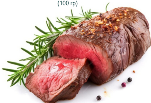
МИНЬОН ПРАЙМБИФ MIGNON 1195 (100 гр)